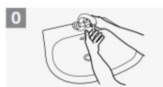
Bagna le mani con l'acqua