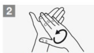
friziona le mani palmo contro palmo