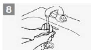
Risciacqua le mani con l'acqua