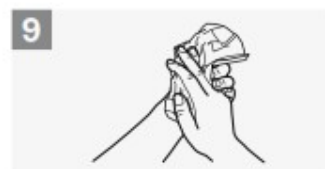
asciuga accuratamente con una salvietta monouso