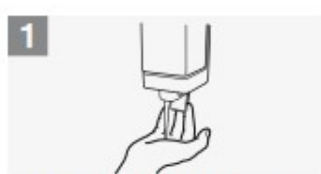
applica una quantità di sapone sufficiente per coprire tutta la superficie delle mani