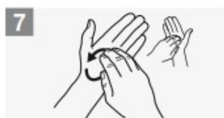
frizione rotazionale, in avanti ed indietro con le dita della mano destra strette tra loro nel palmo sinistro e viceversa