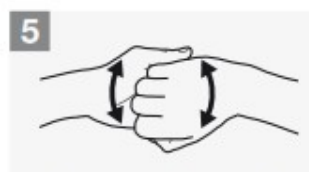
dorso delle dita contro il palmo opposto tenendo le dita strette tra loro