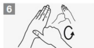
frizione rotazionale del pollice sinistro stretto nel palmo destro e viceversa