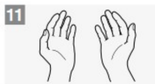
...una volta asciutte, le tue mani sono sicure.