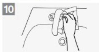
usa la salvietta per chiudere il rubinetto