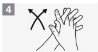
palmo contro palmo intrecciando le dita tra loro